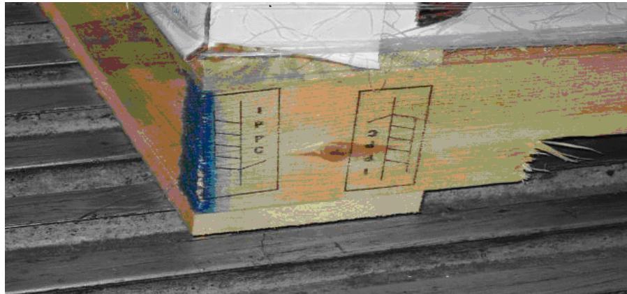
Ejemplo de empaque que no cumple con las normas