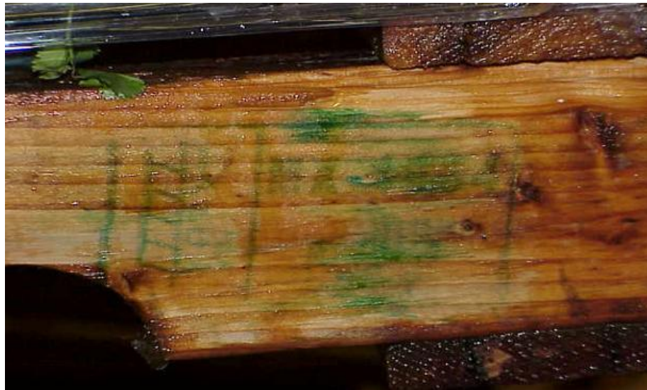
Ejemplo de una Marca de MEM Ilegible

Si se desea más información sobre la implementación y aplicación forzosa de la reglamentación aplicable a los MEM relacionada con las penas convencionales y multas aplicables por favor visite el portal de Internet de la CBP (CBP.GOV).